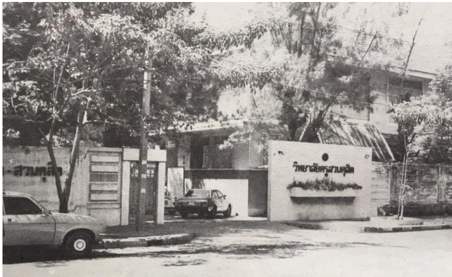
วิทยาลัยครูสวนดุสิต 4

ภาษาไทย ภาษาอังกฤษ สังคมศึกษา วิทยาศาสตร์ทั่วไป คหกรรมศาสตร์ ศิลปศึกษา การศึกษาพิเศษ การอนุบาลศึกษา การประถมศึกษา อุตสาหกรรมศิลป์ และคณิตศาสตร์ ในเวลาต่อมา พระราชบัญญัติวิทยาลัยครู พ.ศ. 2527 (ฉบับที่ 2) อนุญาตวิทยาลัยครูสามารถเปิดสอนสายวิชาการอื่นได้นอกจากสายวิชาชีพครู วิทยาลัยครูสวนดุสิตจึงเปิดสอนหลักสูตรอนุปริญาศิลปศาสตร์ (อ.ศศ.) จำนวน 3 วิชาเอก ได้แก่ วารสารและการประชาสัมพันธ์ ภาษาอังกฤษ และออกแบบนิเทศศิลป์ และอนุปริญญาวิทยาศาสตร์ (อ.วท.) จำนวน 3 วิชาเอก ได้แก่ การอาหาร ผ่าและเครื่องแต่งกาย และศิลปะประดิษฐ์ ตลอดจนเปิดสอนสาขาวิชาคหกรรมศาสตร์ในระดับปริญญาตรีเป็นแห่งแรกของประเทศไทย อีกทั้ง รัับนักศึกษาชายเข้าศึกษาเป็นครั้งแรกในปี พ.ศ. 2528