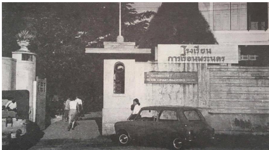
โรงเรียนการเรือนพระนคร 3

เด็ก และการจัดและตกแต่งบ้าน ในหลักสูตร ป.กศ. สาขาเกษตรศาสตร์ หลักสูตร ป.กศ. ชั้นสูง สาขาหัตถกรรมศาสตร์ และการอนุบาล ตลอดจนการจัดตั้งโรงเรียนอนุบาลละอออุทิศ ซึ่งเป็นโรงเรียนอนุบาลของรัฐแห่งแรกในประเทศไทย