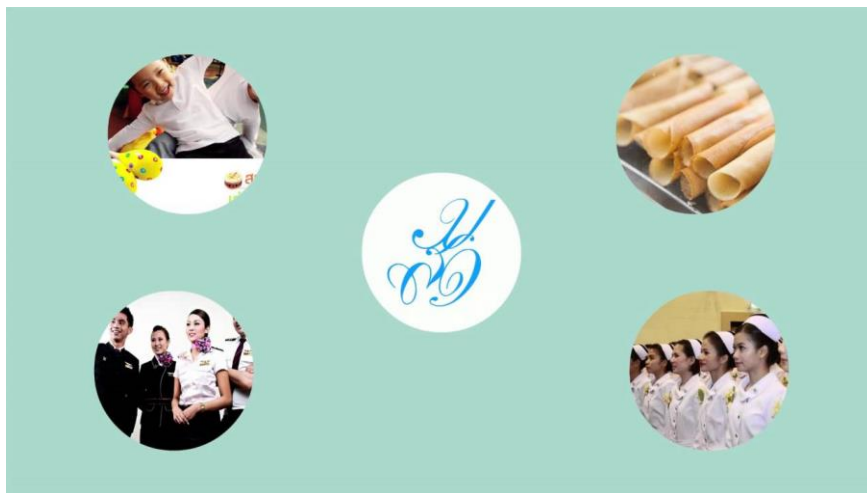
อัตลักษณ์ของมหาวิทยาลัย 6

ในปี พ.ศ. 2550 โรงเรียนสาธิตอนุบาลละอออุทิศได้ร่วมส่วนการบริหารโรงเรียนที่เป็นอนุบาลและประถมศึกษาเข้าด้วยกัน และปรับชื่อโรงเรียนเป็น โรงเรียนสาธิตละอออุทิศ โดยเป็นส่วนงานอิสระขึ้นตรงต่ออธิการบดี